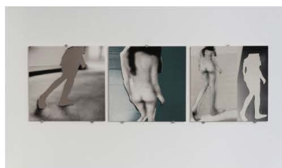
Rachel Rom, Work in progress series . FR-2014. Tirage numérique. © Rachel Rom. Courtesy Galerie E.G.P. Photo: Adrien Chevrot

Car trace après trace, et plus qu'une photographie capturant la présence, Rachel Rom construit une esthétique du palimpseste, où les signes visuels s'emplit à la manière de strates géologiques. L'œuvre est comme bouleversée physiquement: découpage, collages, disparitions de visages au fur et à mesure des re-photographies sont autant d'occurrences qui viennent mettre en abîme les œuvres, et l'artiste elle-même.