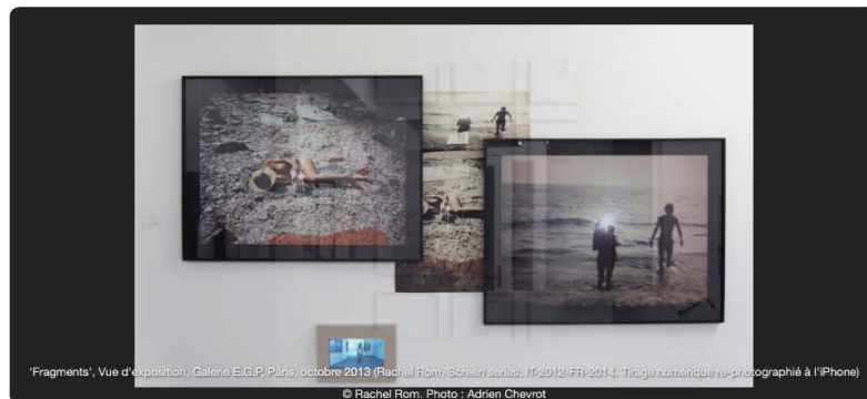
'Fragments', Vue d'exposition, Galerie E.G.P, Paris, octobre 2013 (Rachel Rom; Screen series; FR2012/FR-2014; Tirage numérique re-photographié à l'iPhone) © Rachel Rom. Photo: Adrien Chevrot

Une exposition que nous avons choisi de vous présenter avec des visuels in situ , afin de mieux rendre compte du travail de l'artiste, de la prise de vue en passant par la re-photographie jusqu'à l'accrochage de ses œuvres.