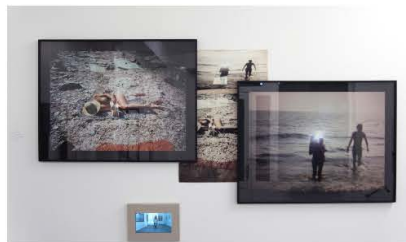
'Fragments', Vue d'exposition, Galerie E.G.P, Paris, octobre 2013 (Rachel Rom, Screen series, IT-2012-FR-2014. Tirage numérique re-photographié à l'iPhone)

J'inclus d'ailleurs à présent des repères géographiques et temporels à mes séries. Par exemple le portrait de famille de la série « screen » s'appelle screen IT 2012 (photo argentique) FR 2014 (re-photo numérique Iphone). »