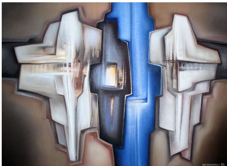
Roger Desserprit, Composition, 1977, huile sur toile

Musée d'Art Moderne de la Ville de Paris Musée des Ursulines, Mâcon Musée de Grenoble